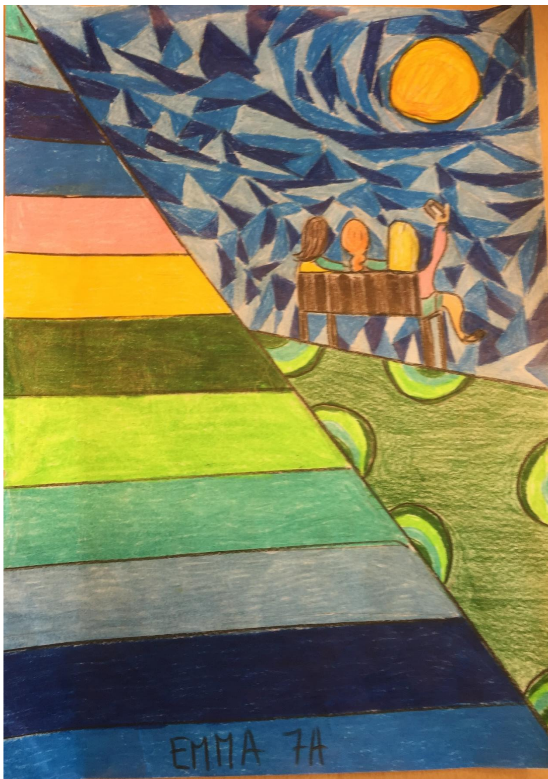
Handlingsplan mot mobbing Hovinhøgda skole og SFO